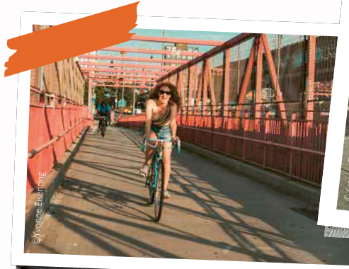
New York, New York - I feel your spirit!

Gerade bin ich mit meinem neuen Buch «Life Rebel» beschäftigt, das Ende März erscheint. Ebenfalls aktuell ist die Arbeit an einem Drehbuch für eine Serie. Mein Alltag ist aber nur bedingt von meinem Job bestimmt. Ich schaue sehr darauf, dass ich genügend Pausen und arbeitsfreie Zeit habe. Ich glaube, dass man viel erleben muss, wenn man gute Geschichten erzählen will, und ich möchte genug Zeit für meine Freundinnen und Freunde sowie meine Familie haben.