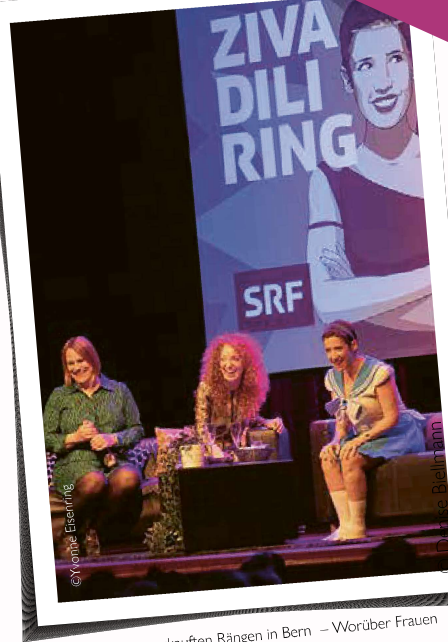
«Zivadliring» vor ausverkauften Rängen in Bern – Worüber Frauen reden, wenn sie unter sich sind?